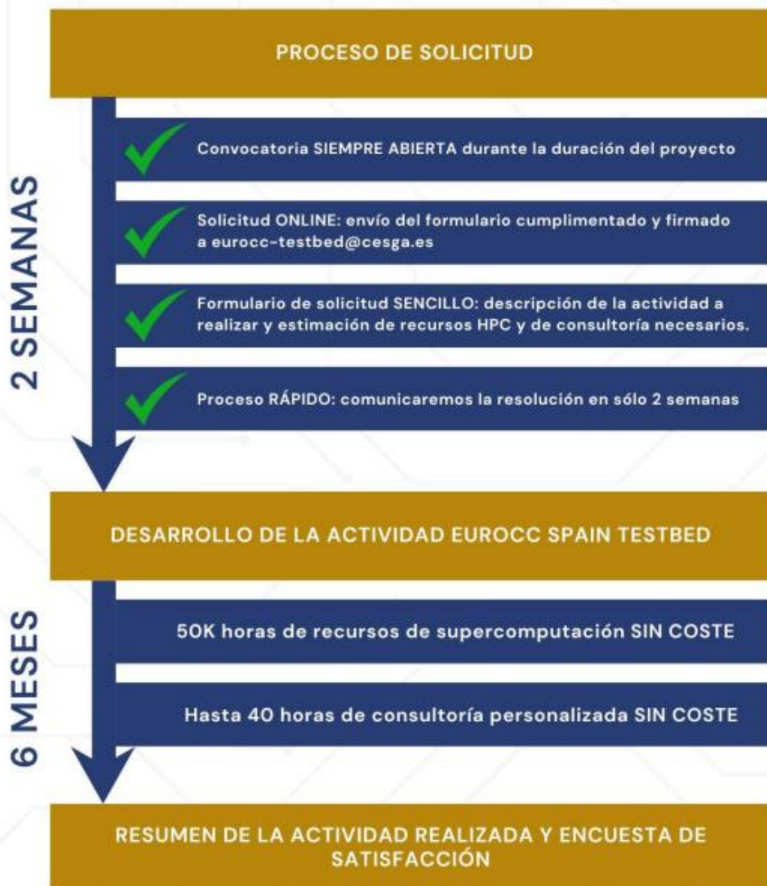
Figura 1. Aspectos clave de la convocatoria.